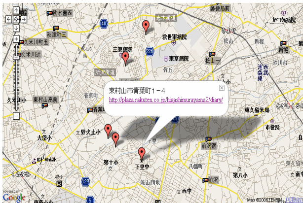
図 2. 情報表示の様子

このコンポーネントは、緯度・経度変換コンポーネントで得られた緯度・経度をもとに Google Maps 上にバルーン(マーカー)を表示する機能を持つ。緯度・経度変換コンポーネントで得られた数値(緯度・経度)を Google Maps API[13]に渡し、数値をもとに地図上にバルーンと個人サイトの URL を表示させる。これによって、位置指向検索が可能な個人サイトのグルメ情報提供するグルメ検索サイトが実現する。実際にこのコンポーネントを利用した結果の表示画面を図 2 に示す。各個人サイトに含まれる位置に基づいて地図上にバルーンをプロットしている。バルーンをクリックすると、表示されている位置の店舗について記述のある個人サイトへのリンクが表示される。